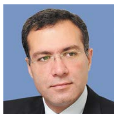
Мовсумов Шахмар Ариф оглы

Президент – Председатель Правления Банка ВТБ (ПАО)