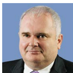
Варник Артур Маттиас

Председатель Наблюдательного совета Министр финансов Российской Федерации