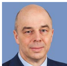
Силуанов Антон Германович

Председатель Наблюдательного совета Министр финансов Российской Федерации